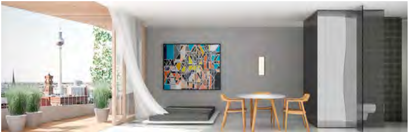
Microeinheit 1-Zimmer Apartment