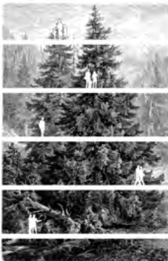
Wipfel | Panorama